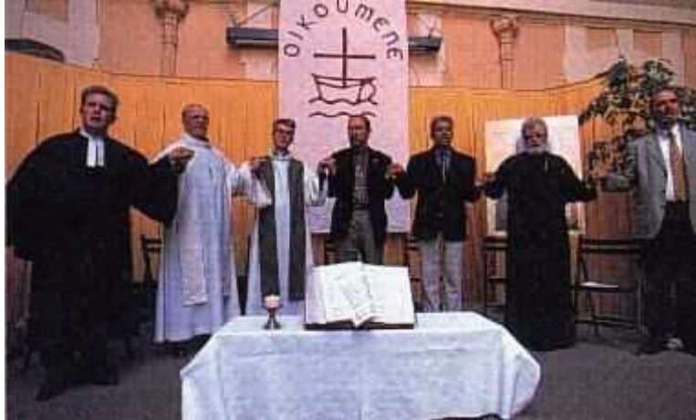
Sacerdotes católicos y pastores evangélicos de diferentes denominaciones oficiando juntos

Algunos líderes cristianos que nos ministraban con profundos artículos en contra de la apostasía, nos sorprendieron, pues se quitaron la máscara de buenos cristianos, y se lanzaron con odio durante ese mes enero contra el pueblo de Israel. Un líder de apellido Paz, fue cruel contra Israel, y le siguieron otros; con ello quedó demostrado que el espíritu antisemita está penetrando en el seno iglesia evangélica.