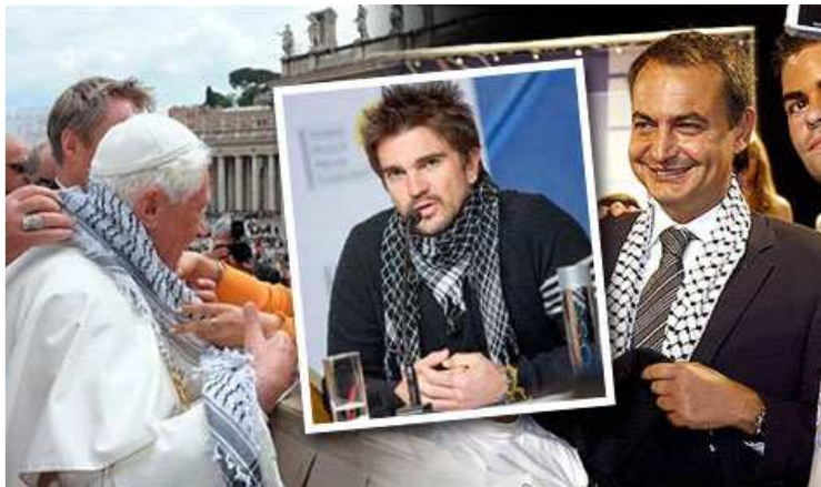
El papa Benedicto XVI, el cantante Juanes y el presidente Zapatero, portando el keffiyeh en eventos públicos.

Algunos líderes cristianos que nos ministraban con profundos artículos en contra de la apostasía, nos sorprendieron, pues se quitaron la máscara de buenos cristianos, y se lanzaron con odio durante ese mes enero contra el pueblo de Israel. Un líder de apellido Paz, fue cruel contra Israel, y le siguieron otros; con ello quedó demostrado que el espíritu antisemita está penetrando en el seno iglesia evangélica.